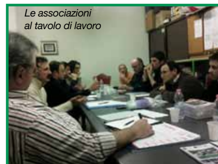
Le associazioni al tavolo di lavoro

sta meta. La validità degli incontri, si è riscontrata dal fatto che da subito e in modo globale, vi è la volontà di costituire un raggruppamento con un rappresentante per ciascuna associazione capace di concretizzare la sinergia tra i vari insiemi. Un gruppo di lavoro con il compito di disciplinare le varie associazio-