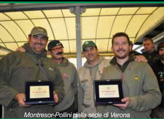
Montesor-Pollini della sede di Verona