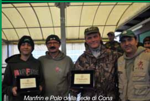
Manfrin e Polo della sede di Cona