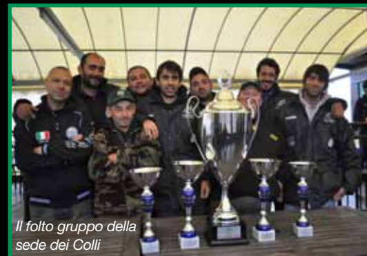
Il folto gruppo della sede dei Colli