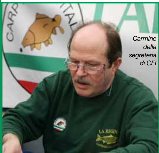
Carmine della segreteria di CFI

Come da sempre sostenuto e comunicato in altri interventi, il lavoro rivolto a creare una sinergia continua e avvalorata da documenti che la consolidassero nel tempo sta ottenendo dei risultati concreti. Come Presidente di CFI ho partecipato a diversi incontri con i rappresentanti delle seguenti altre varie associazioni: